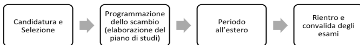
Figura 1 – Fasi del processo di mobilità internazionale

Quale che sia lo scambio internazionale di interesse dello studente (Erasmus, Doppia Laurea, programma speciale), il processo è sostanzialmente lo stesso, strutturato in quattro fasi (Figura 1): (i) candidatura ad un bando di mobilità e selezione/ammissione, (ii) programmazione dello scambio (con elaborazione del piano di studi/learning agreement), (iii) periodo all'estero di scambio, (iv) rientro in Italia e convalida dei risultati raggiunti durante lo scambio.